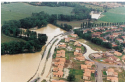
Bassin de l'Hers (juin 1992)