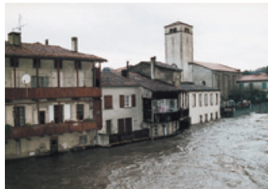
Bassin de l'Agout (décembre 96)