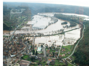
Bassin du Lot (décembre 2003)